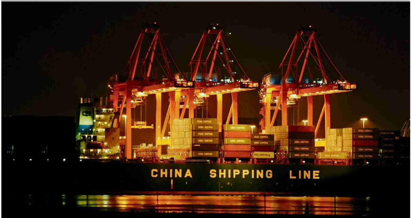
Die chinesischen Exporte in die USA hatten die Wirkung eines Meteoriteneinschlags: Entladen eines Containerschiffs im Hafen von Long Beach.

Themen-Nr.: 377.012 Abo-Nr.: 1070143 Seite: 8 Fläche: 67'705 mm 2